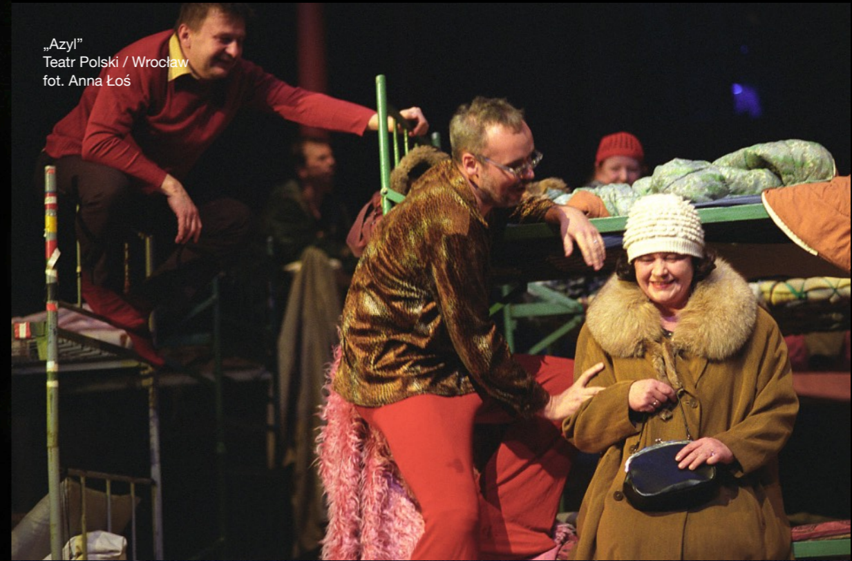
„Azył” Teatr Polski / Wrocław