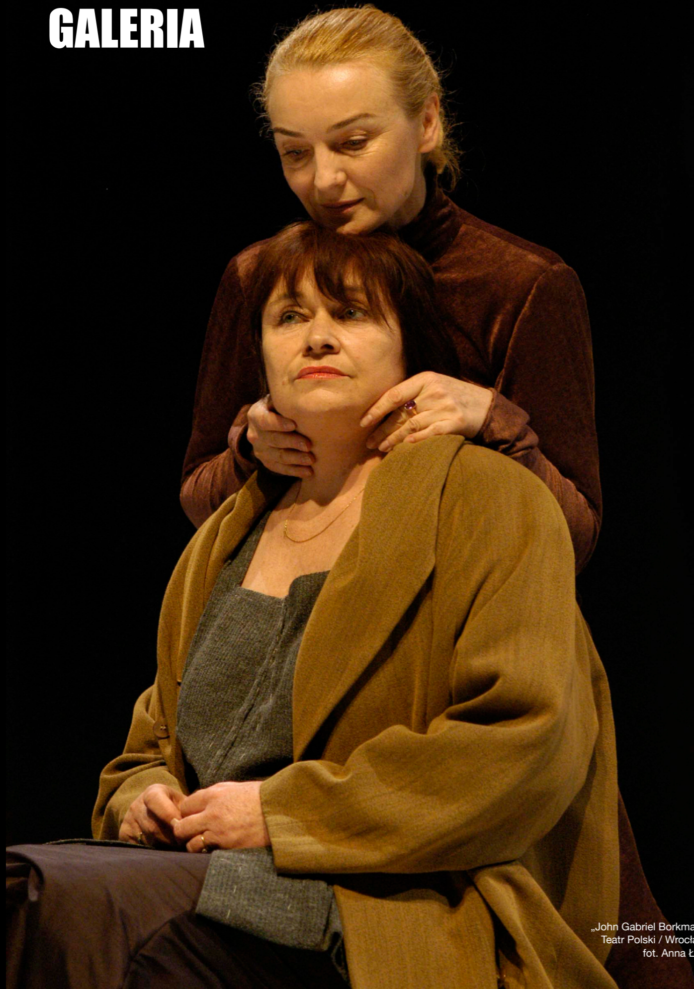
„John Gabriel Borkman” Teatr Polski / Wrocław