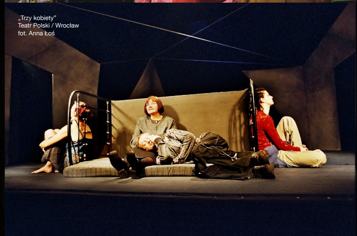
„Trzy kobiety” Teatr Polski / Wrocław