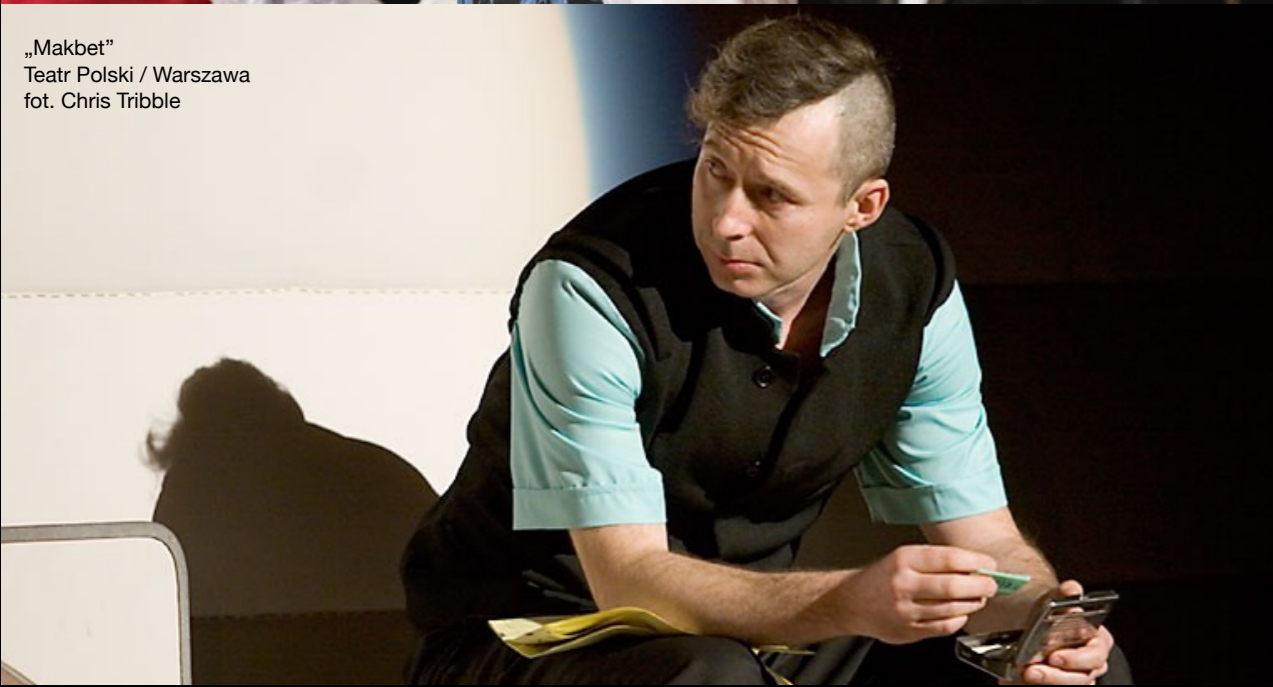
„Makbet” Teatr Polski / Warszawa