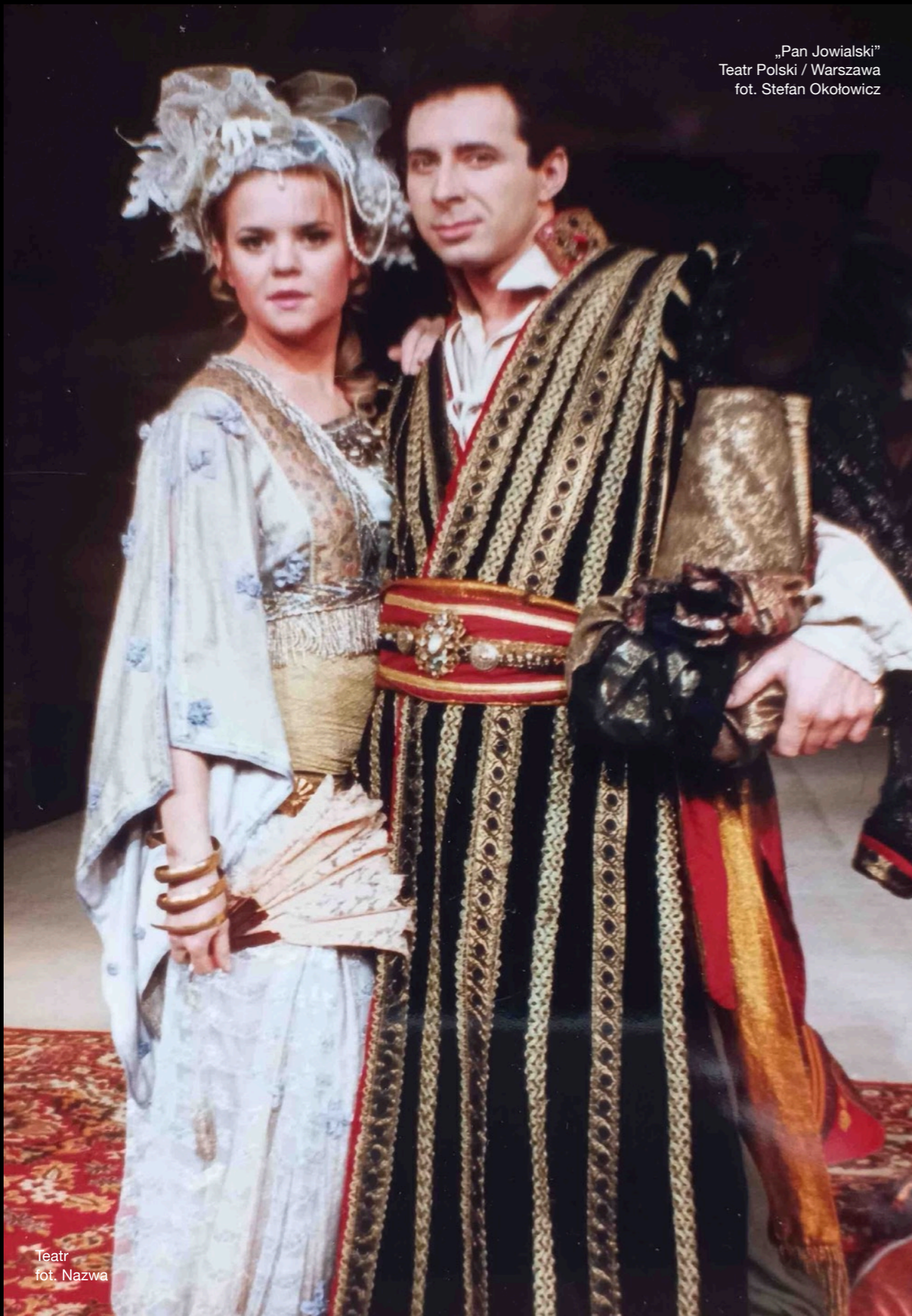
Teatr fot. Nazwa