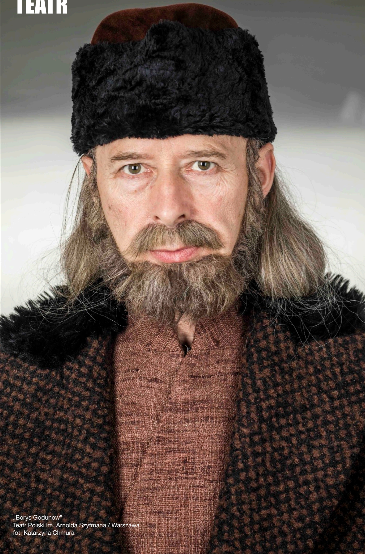
„Borys Godunow” Teatr Polski im. Arnolda Szyfmana / Warszawa