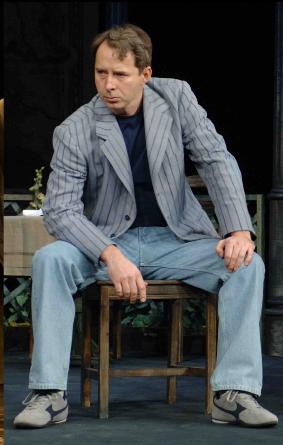
„EuroCity” Teatr Polski / Warszawa