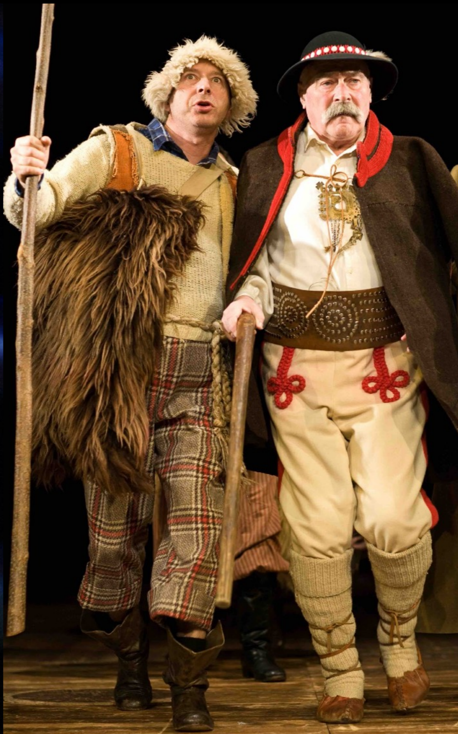
„Pastoralka” Teatr Polski / Warszawa