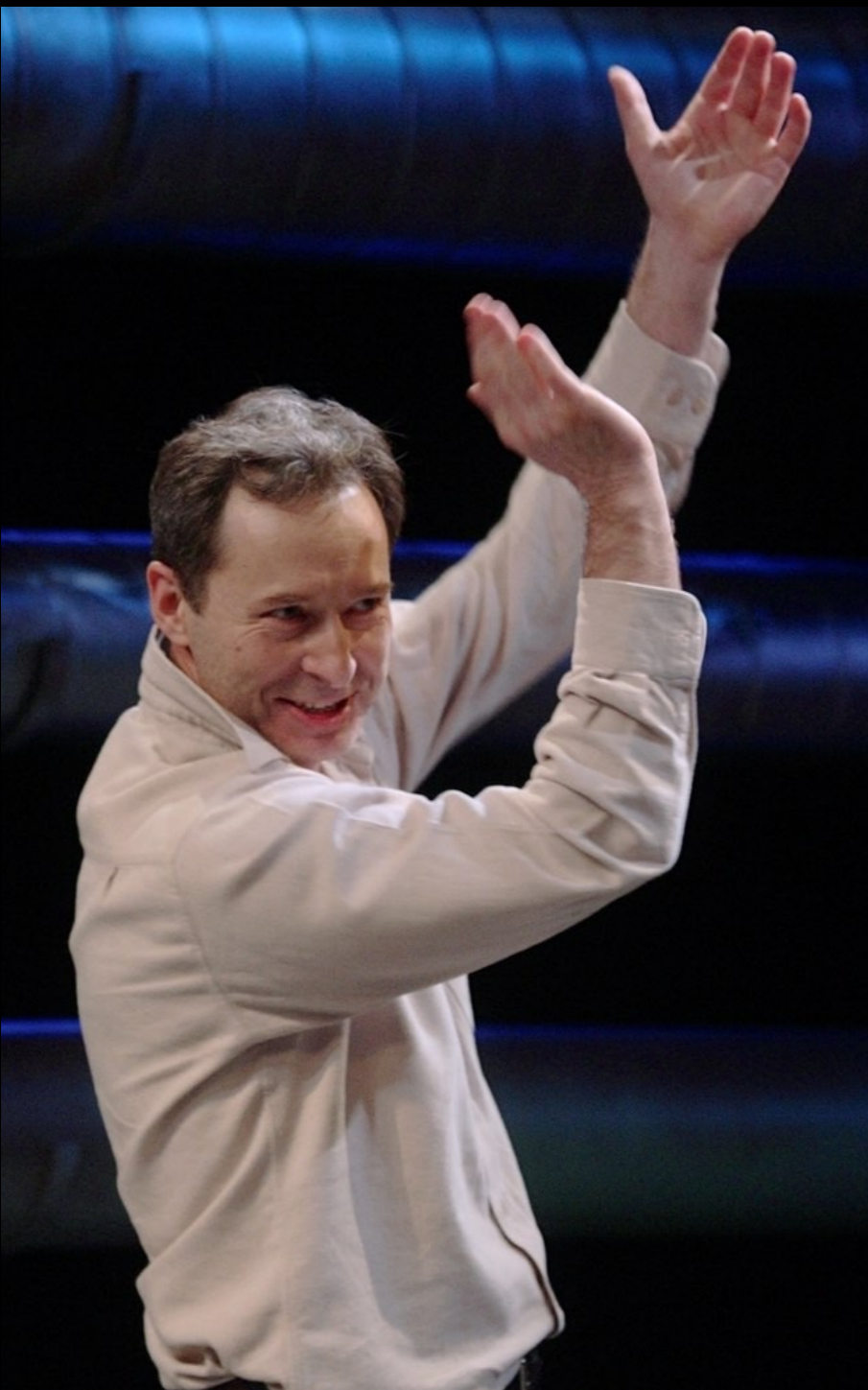
„Emigranci” Teatr Powszechny im. Jana Kochanowskiego / Radom