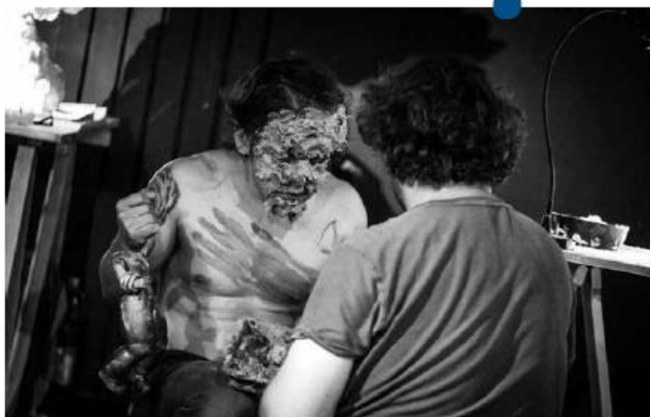
EU.GENUS (Med a prach)