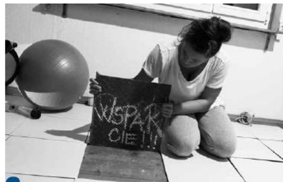
UŠPIM ŤA A DÁVAJ SI POZOR (Divadlo NUDE)

mnohé iné súčasné podujatia) mala ešte jedného, nepozvaného a nie práve milého, hosta – pandémie COVID-19 a s ňou spojené obmedzenia. Už samotný termín festivalu sa pre epidemiologické odporúčania, ktoré sa menili rýchlosťou obrázkov v kaleidoskope, musel dvakrát presunúť. Nikto s istotou nevedel, či sa vybrané predstavenia vo Varšave podarí odohrať, a ak áno, pred akým veľkým publikom. O to väčšie uznanie patrí umelcom aj organizátorom za to, ako sa s touto výzvou popasovali a koľko úsilia vložili do toho, aby sa aj v súčasnom hygienickom režime hostujúce inscenácie dostali na javisko. Vďaka im aj za to, že umožnili živý prenos takmer všetkých bodov programu a na podujatí sa tak virtuálne mohli zúčastniť aj ľudia, ktorým sa pre koronavírus nepodarilo prísť osobne.