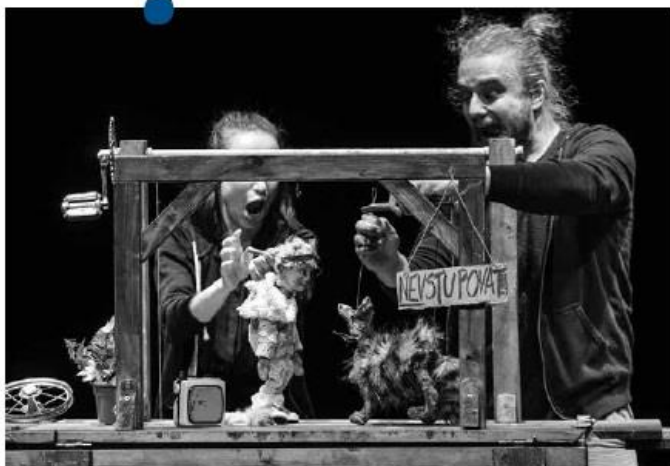
DIVOČINY (Odivo)

Súčasťou festivalu boli aj dve inscenácie pre deti: Divočiny z dielne divadla Odivo a Deďuško v podaní Bratislavského bábkového divadla. Deťom bol venovaný aj koncert skupiny Komajota. Účasť na festivale Dzieję się obok v poslednej chvíli odvolalo Divadlo Nová scéna s predstavením Domov, kde je ten tvoj? . Jednou z hlavných príčin boli epidemiologické riziká. Treba totiž spomenúť, že táto prehliadka (ako