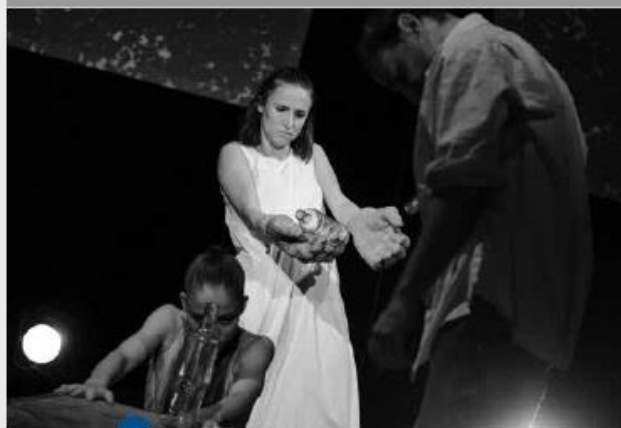
AMERICKÝ CÍSÁR (Divadlo Pôtoň a Štúdio 12)