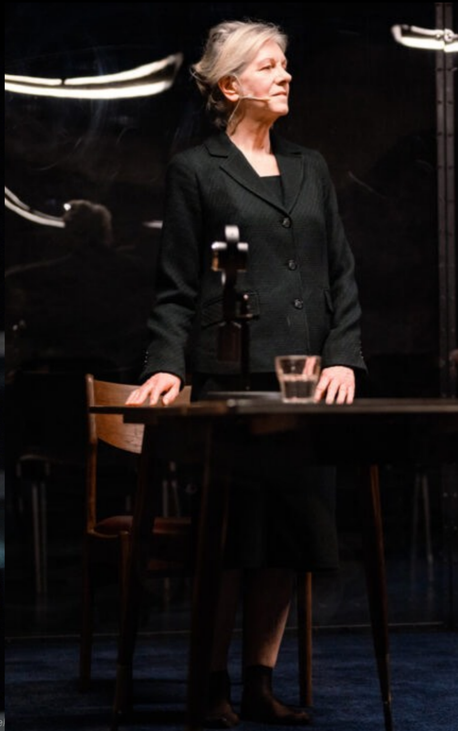
„La Pasionaria” Teatr Współczesny / Szczecin