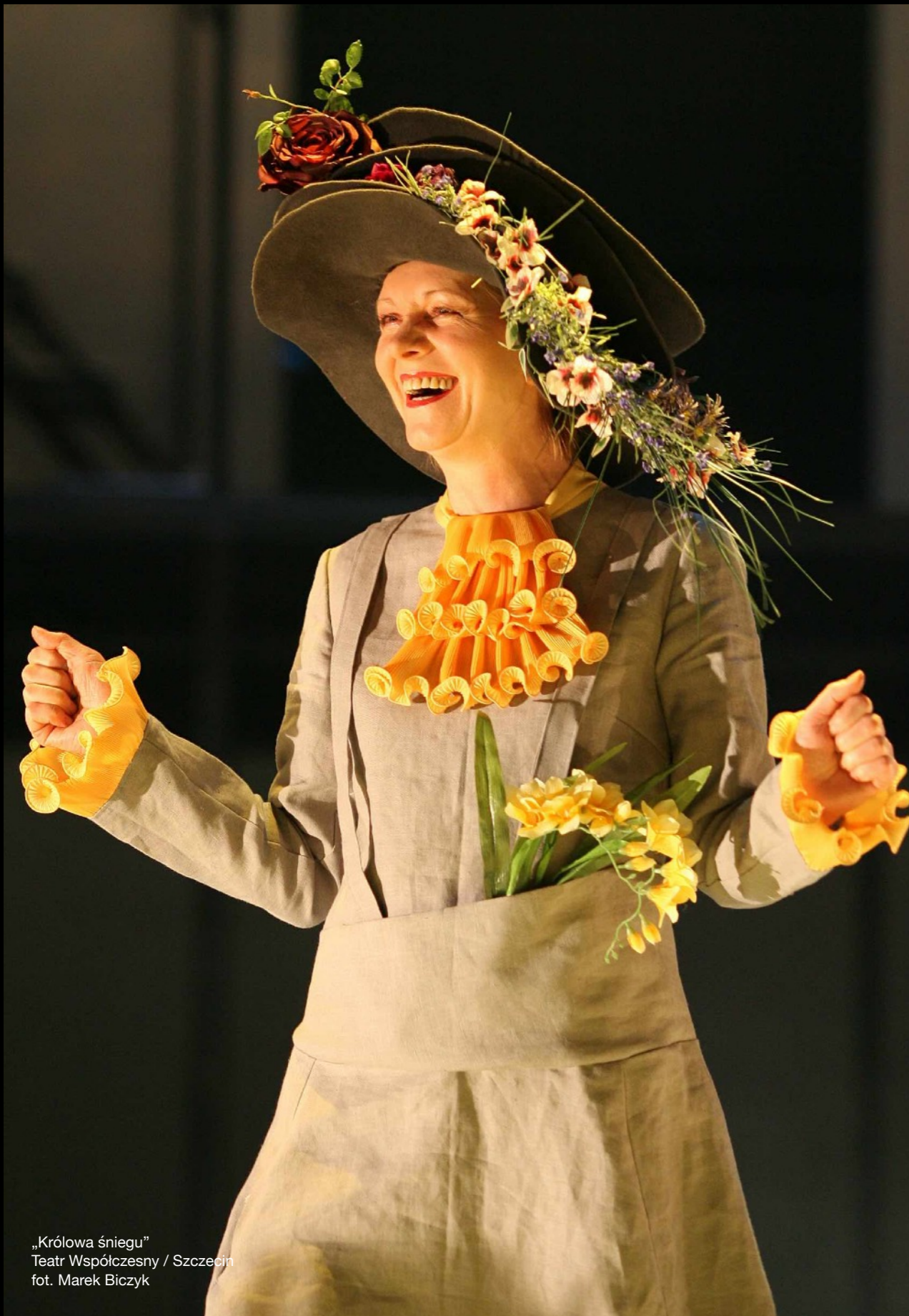
„Królowa śniegu” Teatr Współczesny / Szczecin