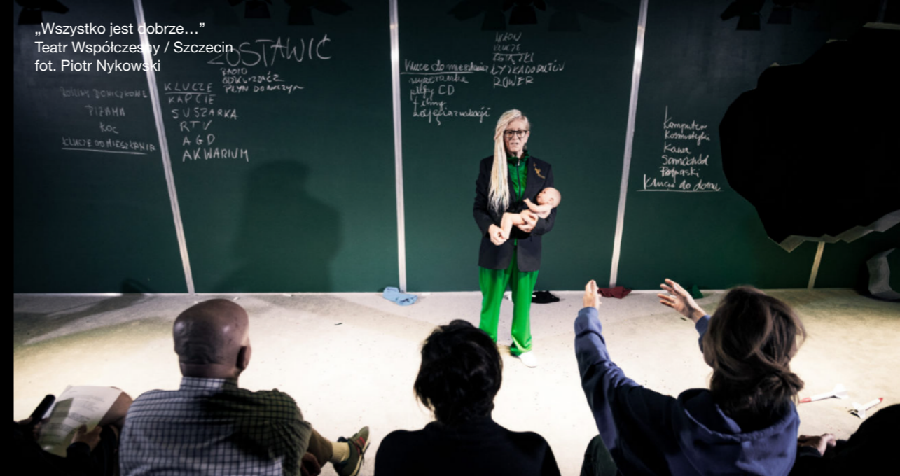
„Wszystko jest dobrze...” Teatr Współczesny / Szczecin