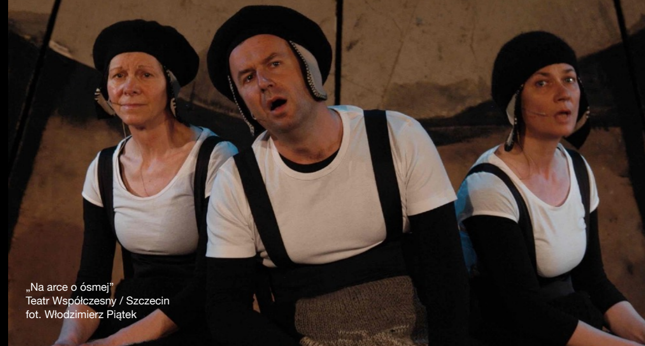
„Na arce o ósmej” Teatr Współczesny / Szczecin