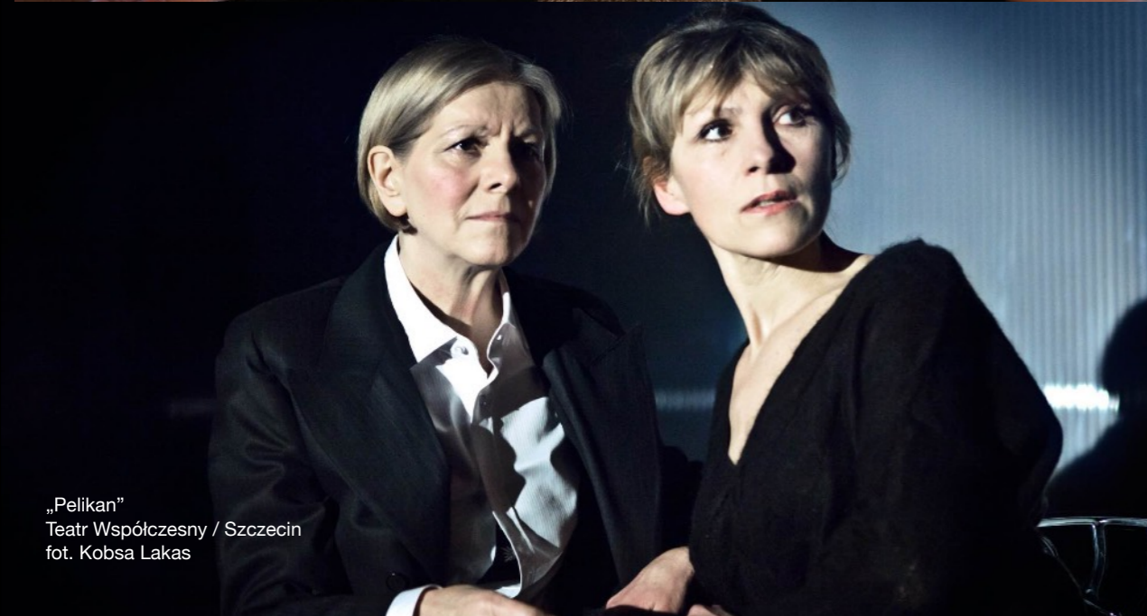
„Pelikan” Teatr Współczesny / Szczecin