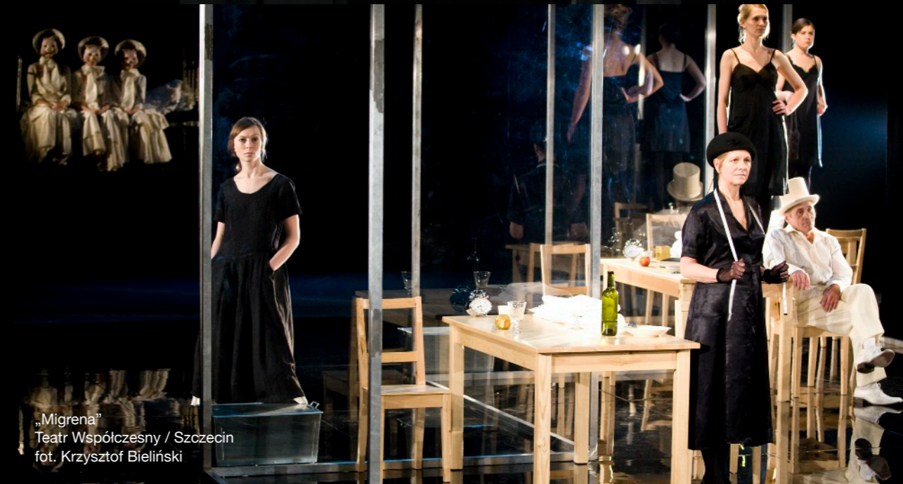
„Migrena” Teatr Współczesny / Szczecin