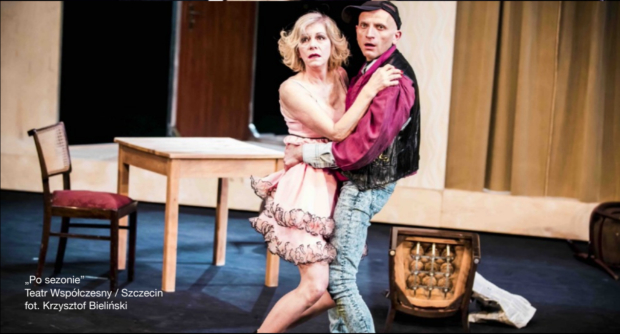
„Po sezonie” Teatr Współczesny / Szczecin