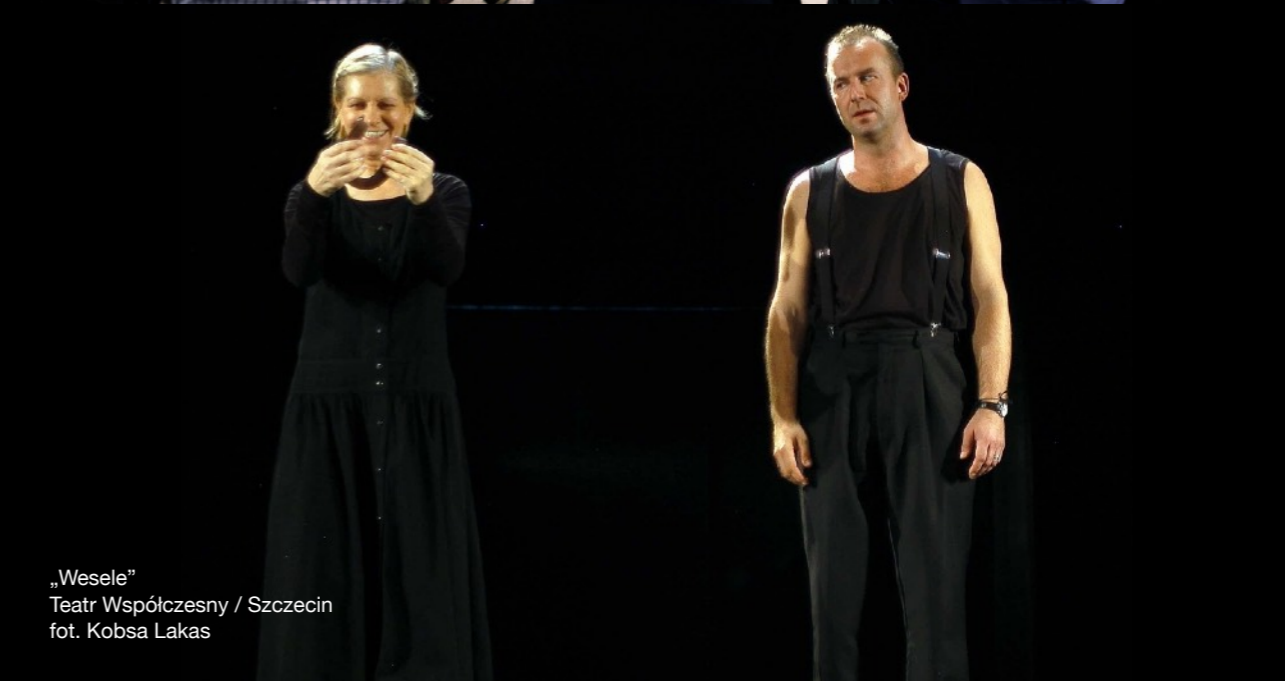
„Wesele” Teatr Współczesny / Szczecin