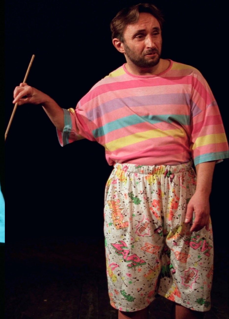
„Seks, prochy, rock&roll” Teatr Ludowy / Kraków