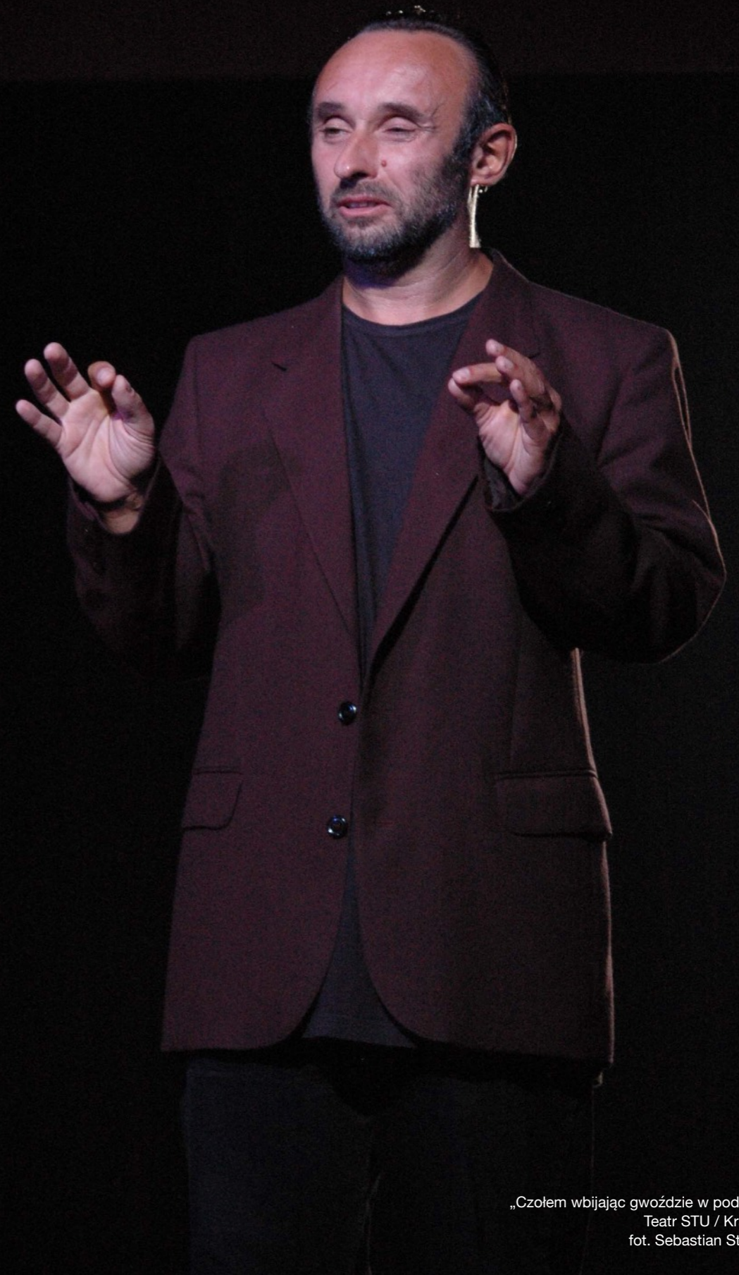
„Czołem wbijając gwoździe w podłogę” Teatr STU / Kraków

„ Rewizor ” M. Gogola rola: Horodniczy reż. M. Sobociński Teatr Bagatela / Kraków