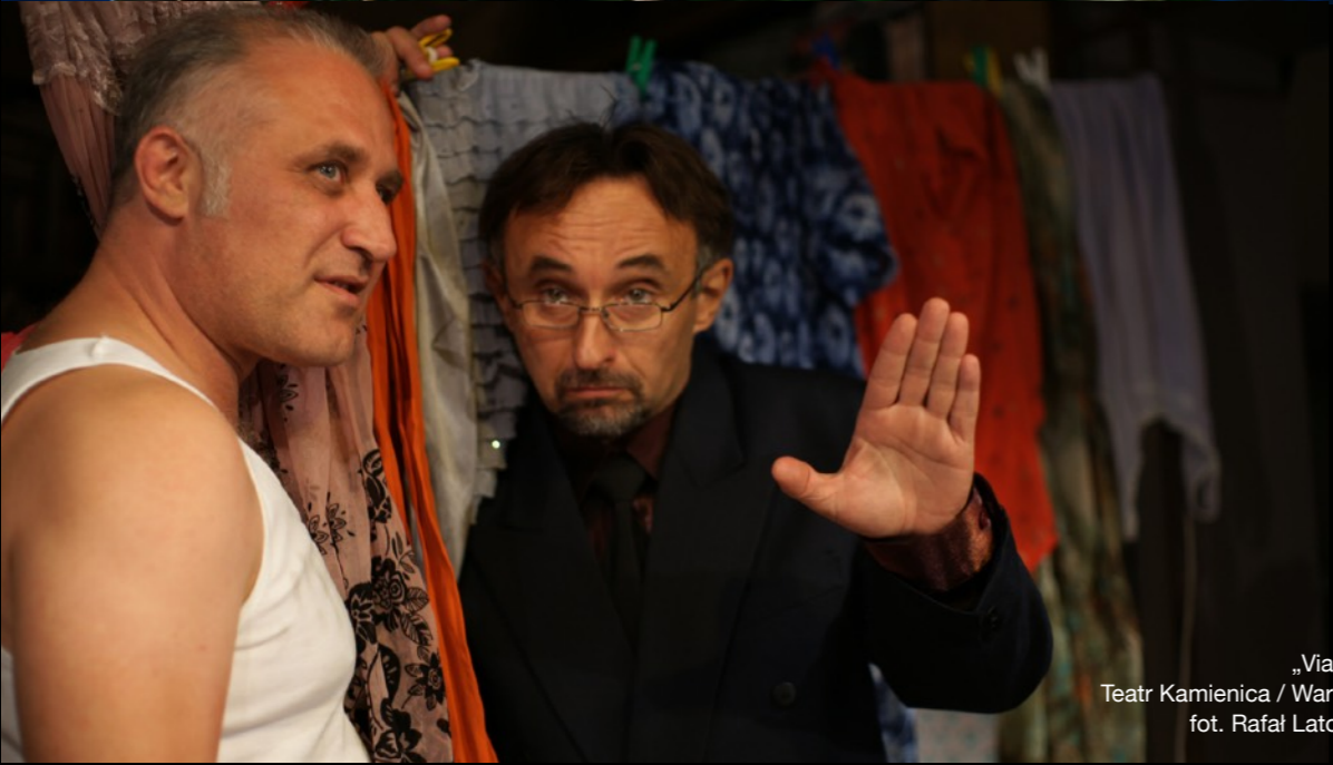
„Via-gra” Teatr Kamienica / Warszawa