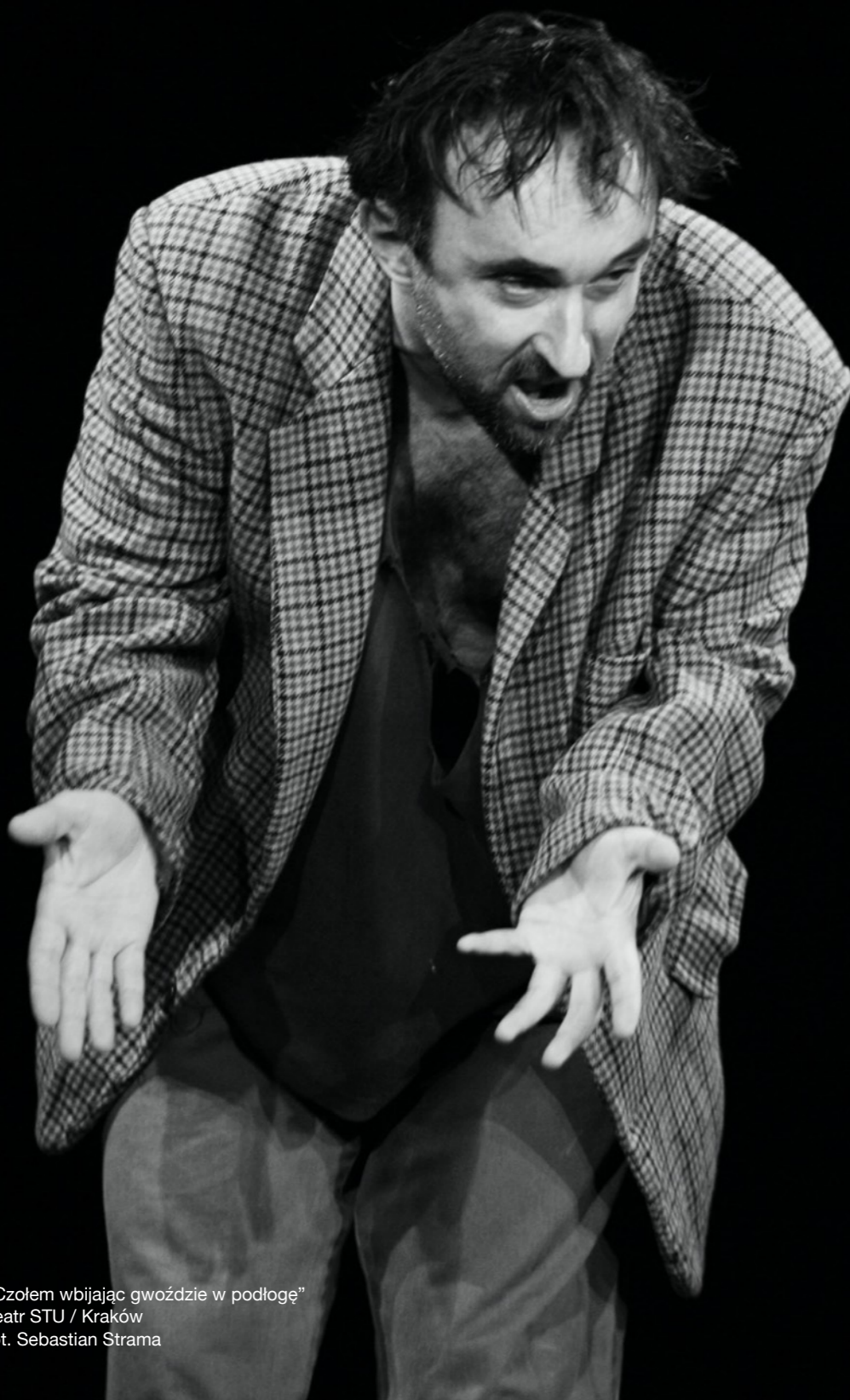
„Czołem wbijając gwoździe w podłogę” Teatr STU / Kraków