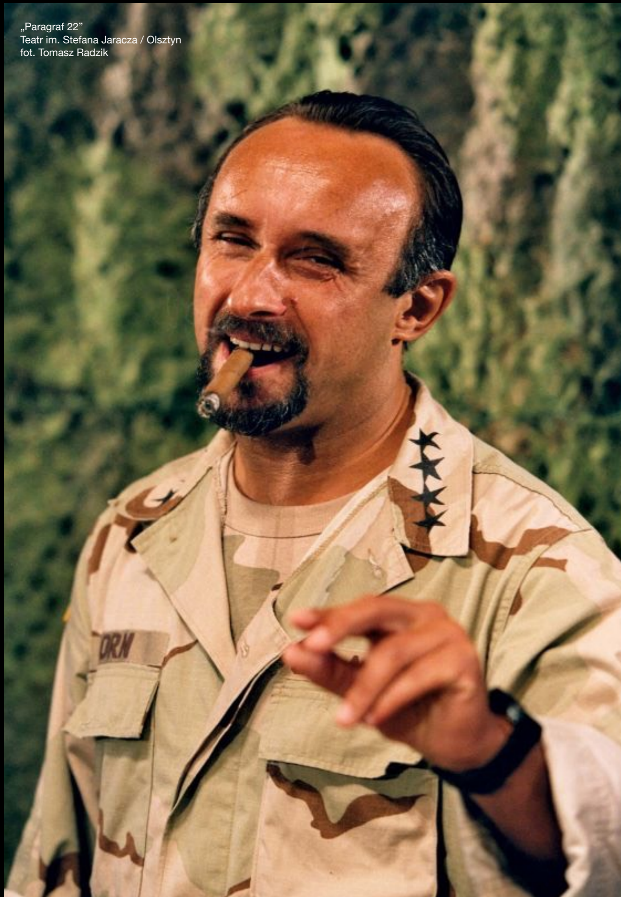
„Paragraf 22” Teatr im. Stefana Jaracza / Olsztyn