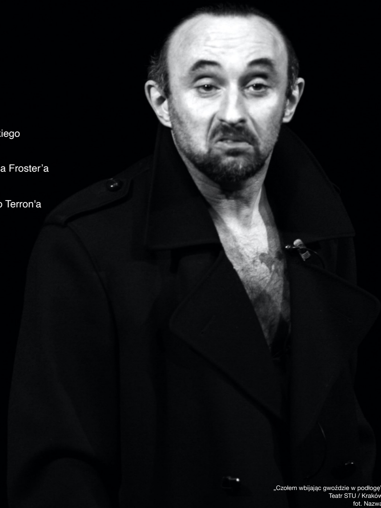
„Czołem wbijając gwoździe w podłogę” Teatr STU / Kraków

„Wszystko o mężczyznach” Miro Gavrana Teatr Ludowy / Kraków