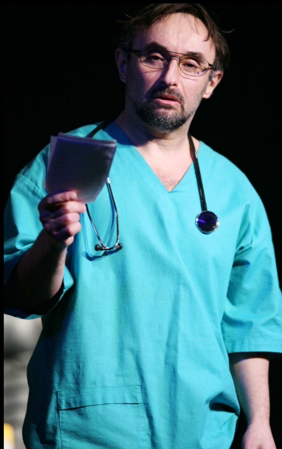
„Czołem wbijając gwoździe w podłogę” Teatr STU / Kraków