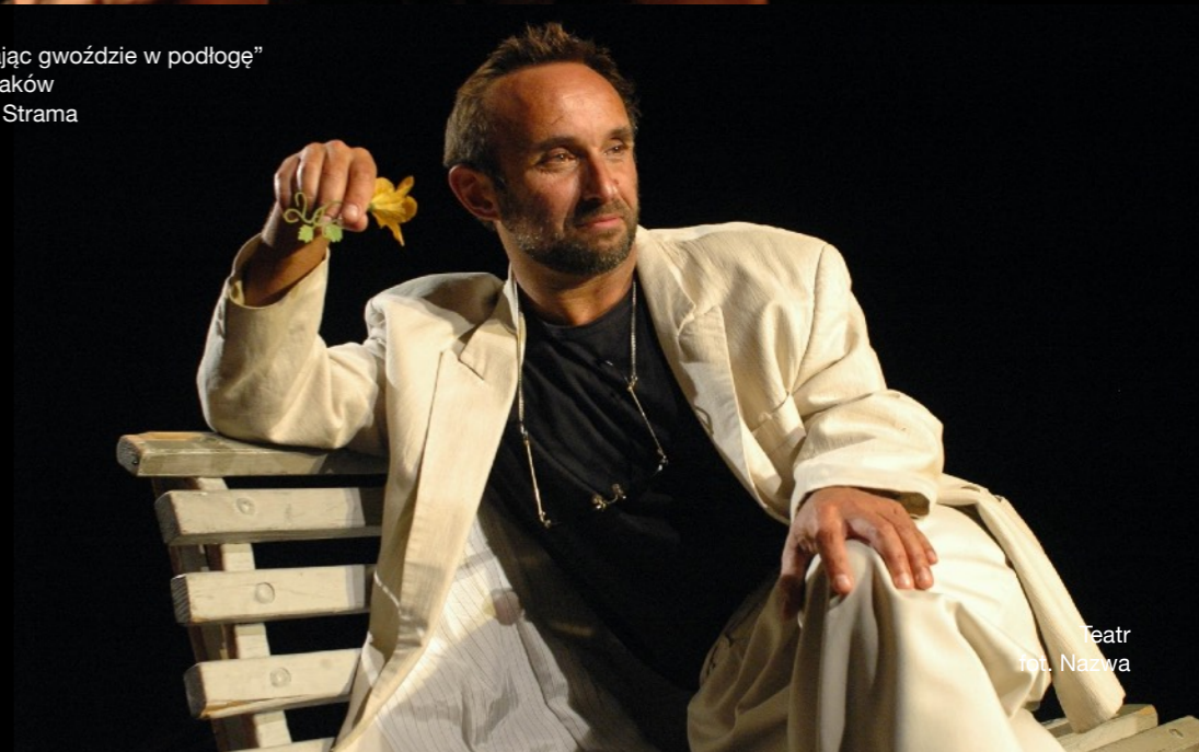
Teatr fot. Nazwa