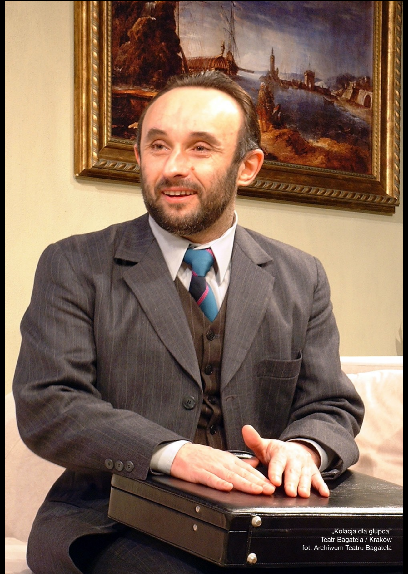
„Kolacja dla głupca” Teatr Bagatela / Kraków