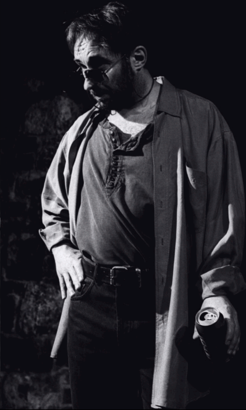
„Seks, prochy, rock&roll” Teatr Ludowy / Kraków