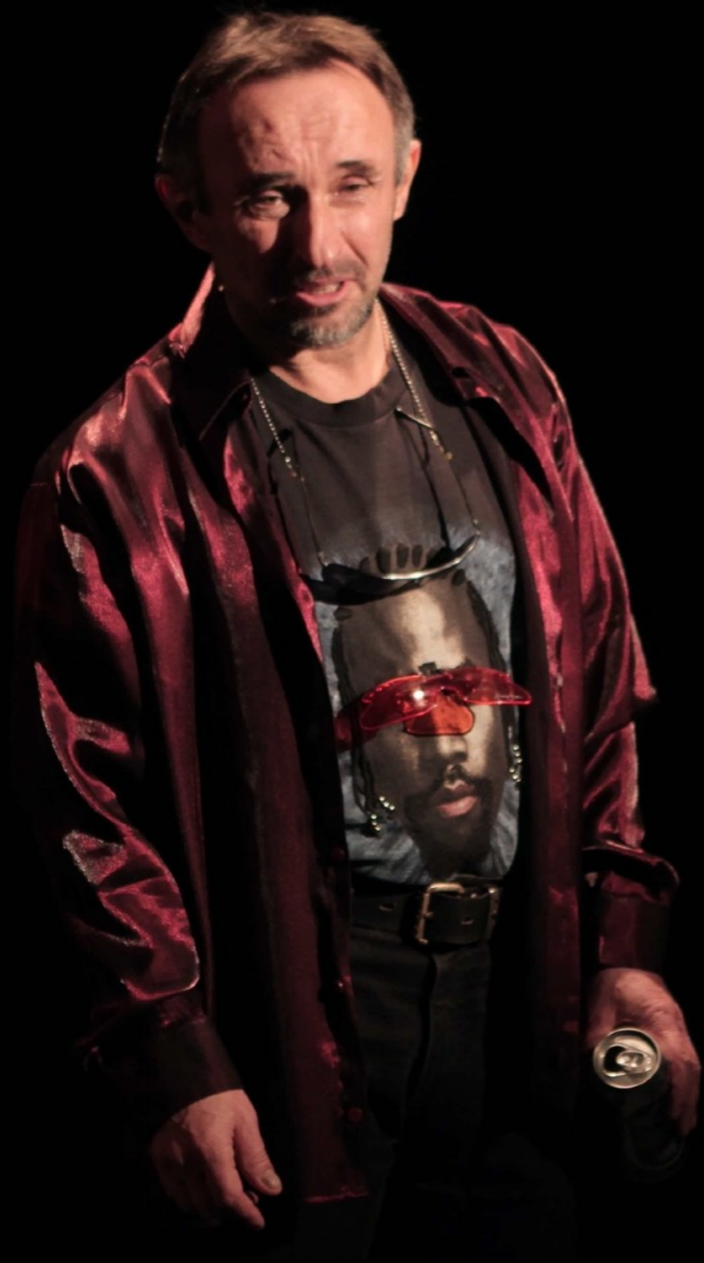
„Seks, prochy, rock&roll” Teatr Ludowy / Kraków