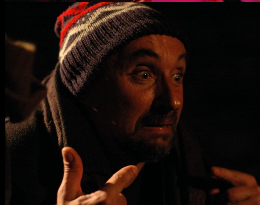
„Czołem wbijając gwoździe w podłogę” Teatr STU / Kraków