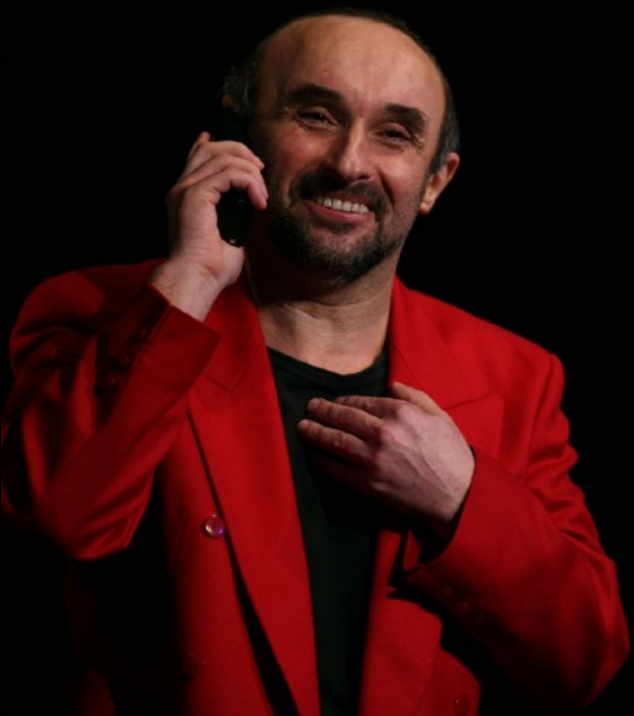
„Czołem wbijając gwoździe w podłogę” Teatr STU / Kraków