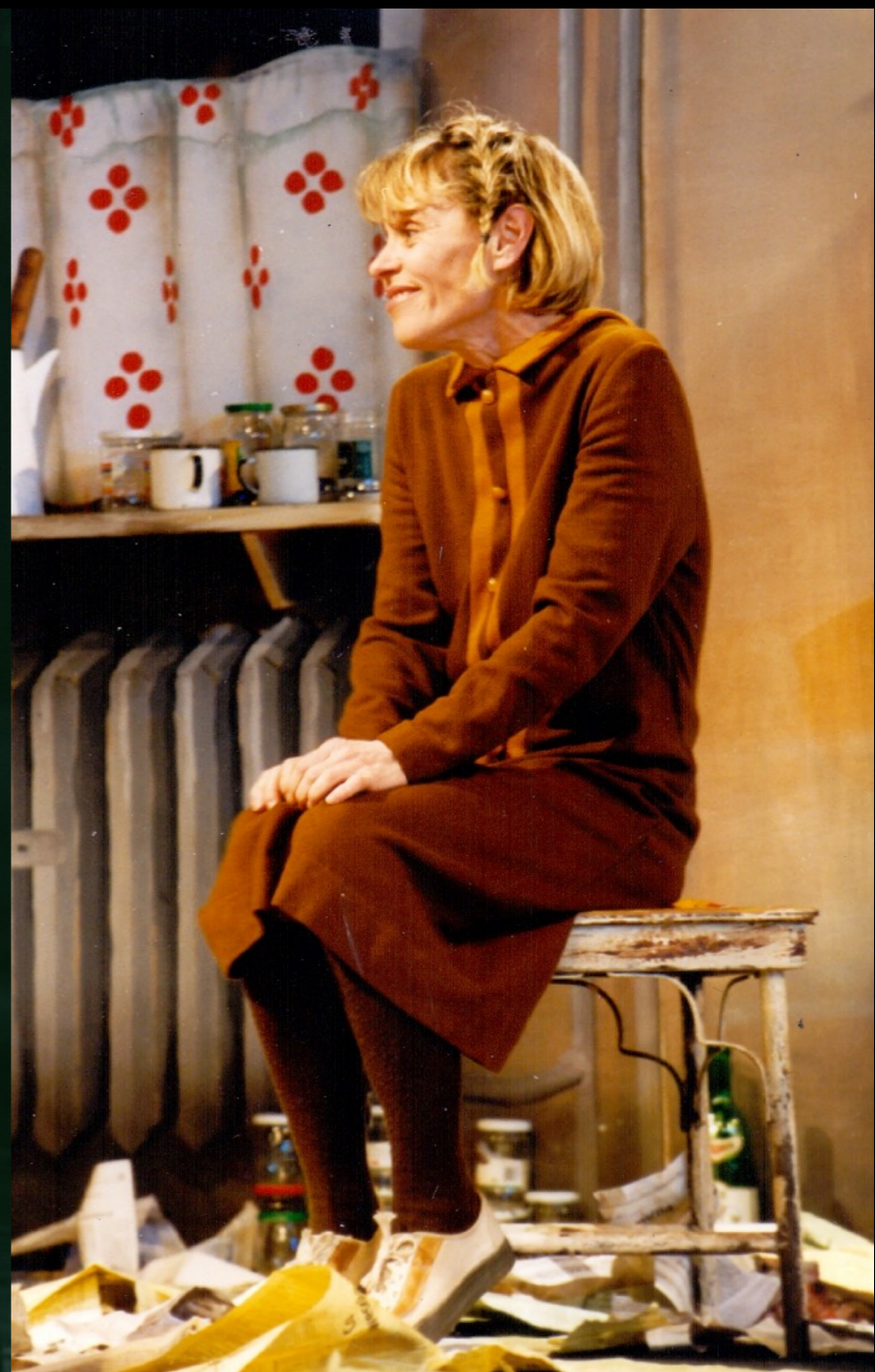
„Prezydentki” Teatr Polski / Bielsko-Biała