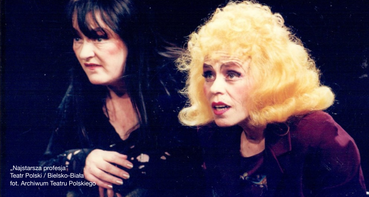
„Najstarsza profesja” Teatr Polski / Bielsko-Biała