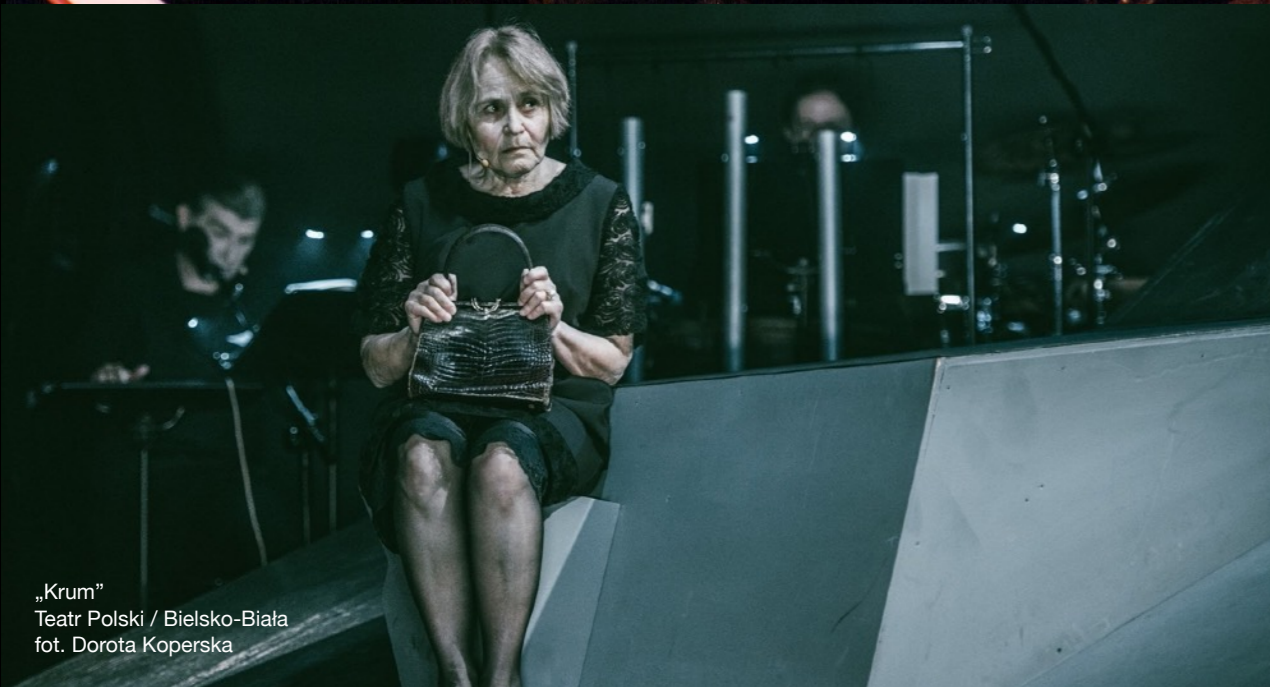
„Krum” Teatr Polski / Bielsko-Biała