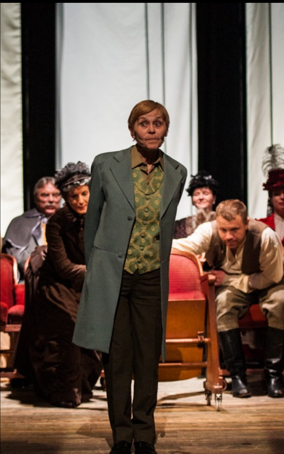
„Lalka” Teatr Polski / Bielsko-Biała