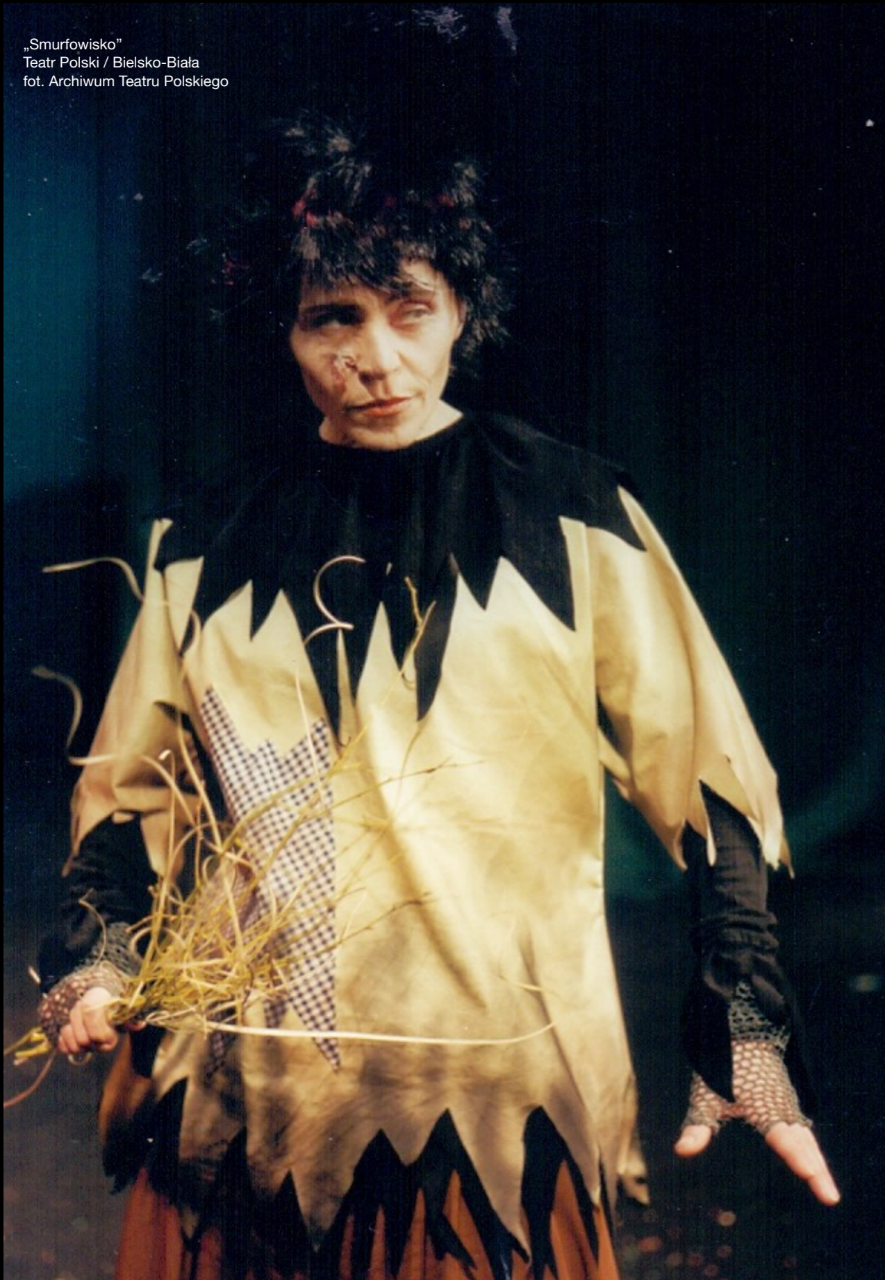
„Smurfowisko” Teatr Polski / Bielsko-Biała