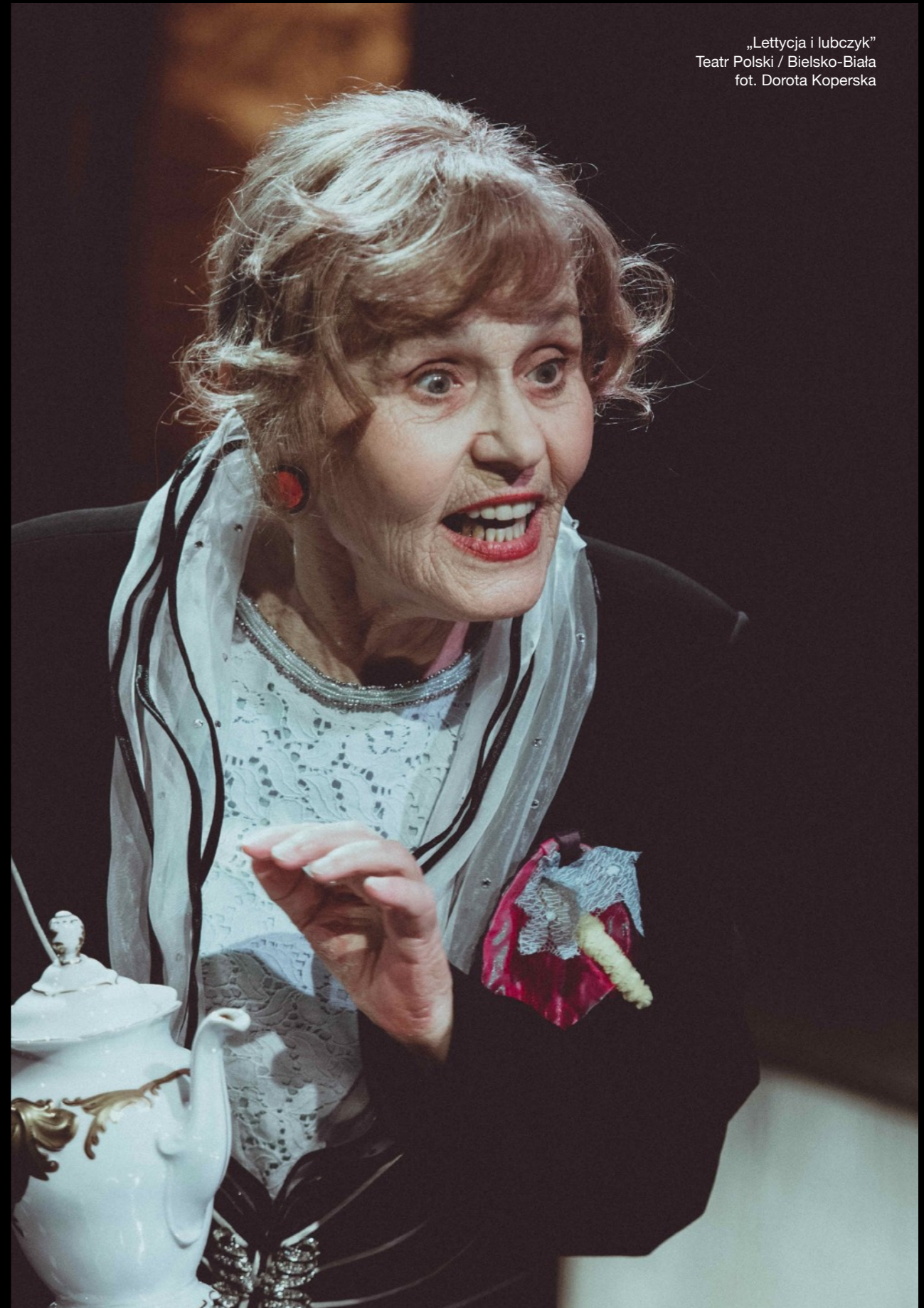
„Letycja i lubczyk” Teatr Polski / Bielsko-Biała