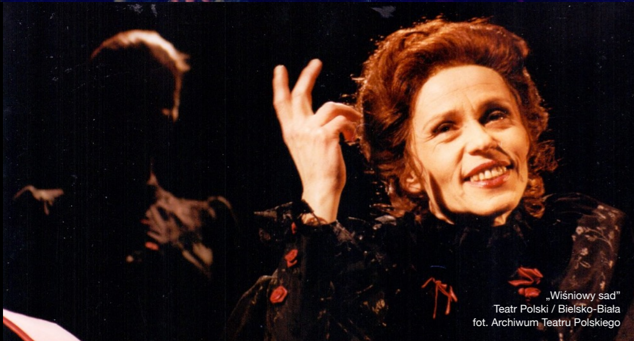
„Wiśniowy sad” Teatr Polski / Bielsko-Biała