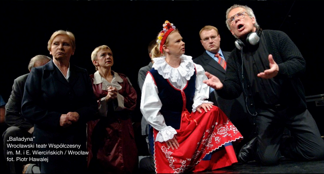
„Balladyna” Wrocławski teatr Współczesny im. M. i E. Wiercińskich / Wrocław