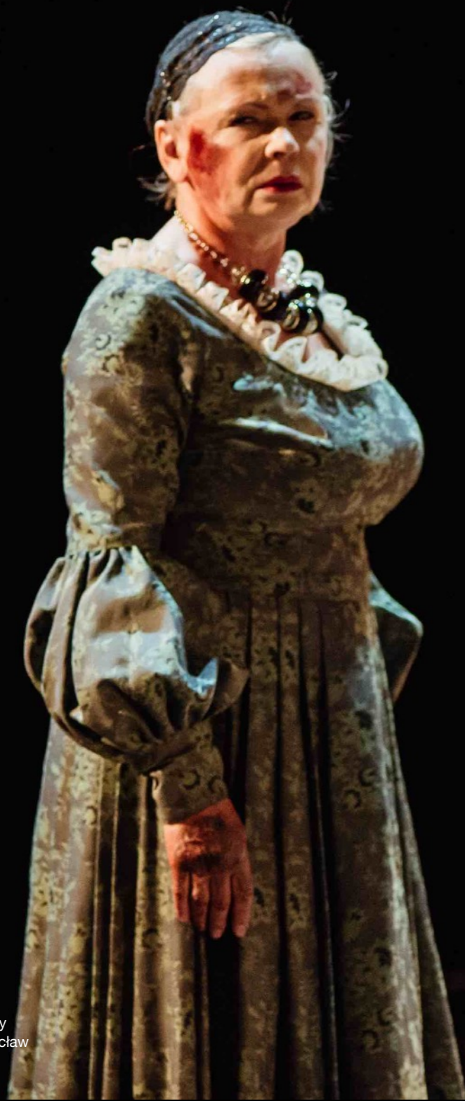
„Widzę nic” Wrocławski teatr Współczesny im. M. i E. Wiercińskich / Wrocław