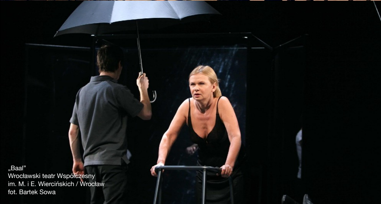
„Baal” Wrocławski teatr Współczesny im. M. i E. Wiercińskich / Wrocław