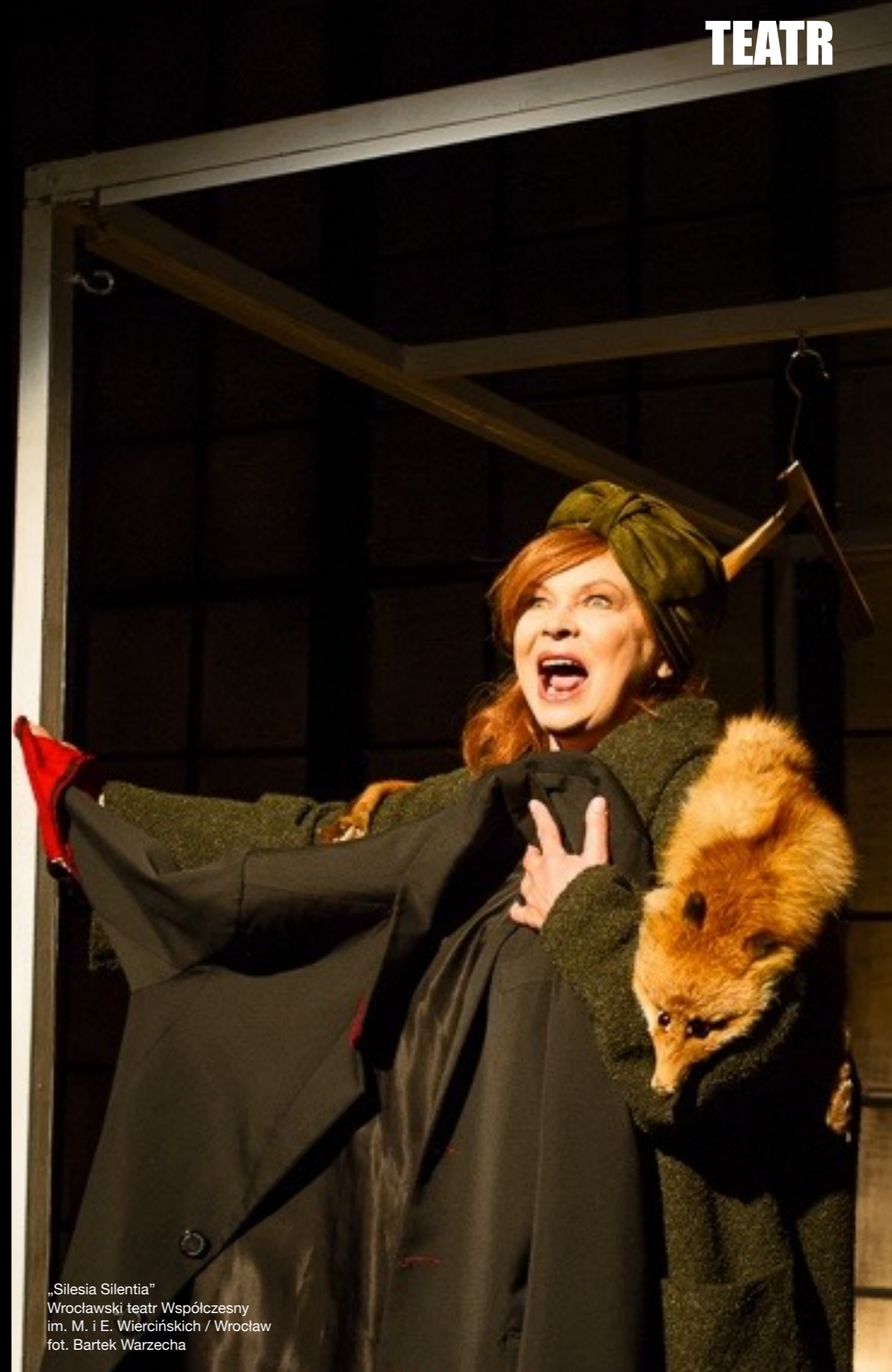
„Silesia Silentia” Wrocławski teatr Współczesny im. M. i E. Wiercińskich / Wrocław

„Pułapka” Tadeusz Różewicz rola: Józia reż. Gabriel Gietzky Współczesny im. Edmunda Wiercińskiego / Wrocław