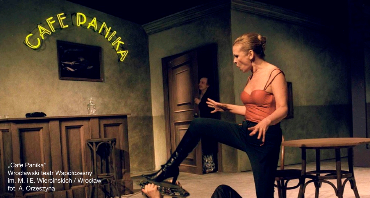
„Cafe Panika” Wrocławski teatr Współczesny im. M. i E. Wiercińskich / Wrocław