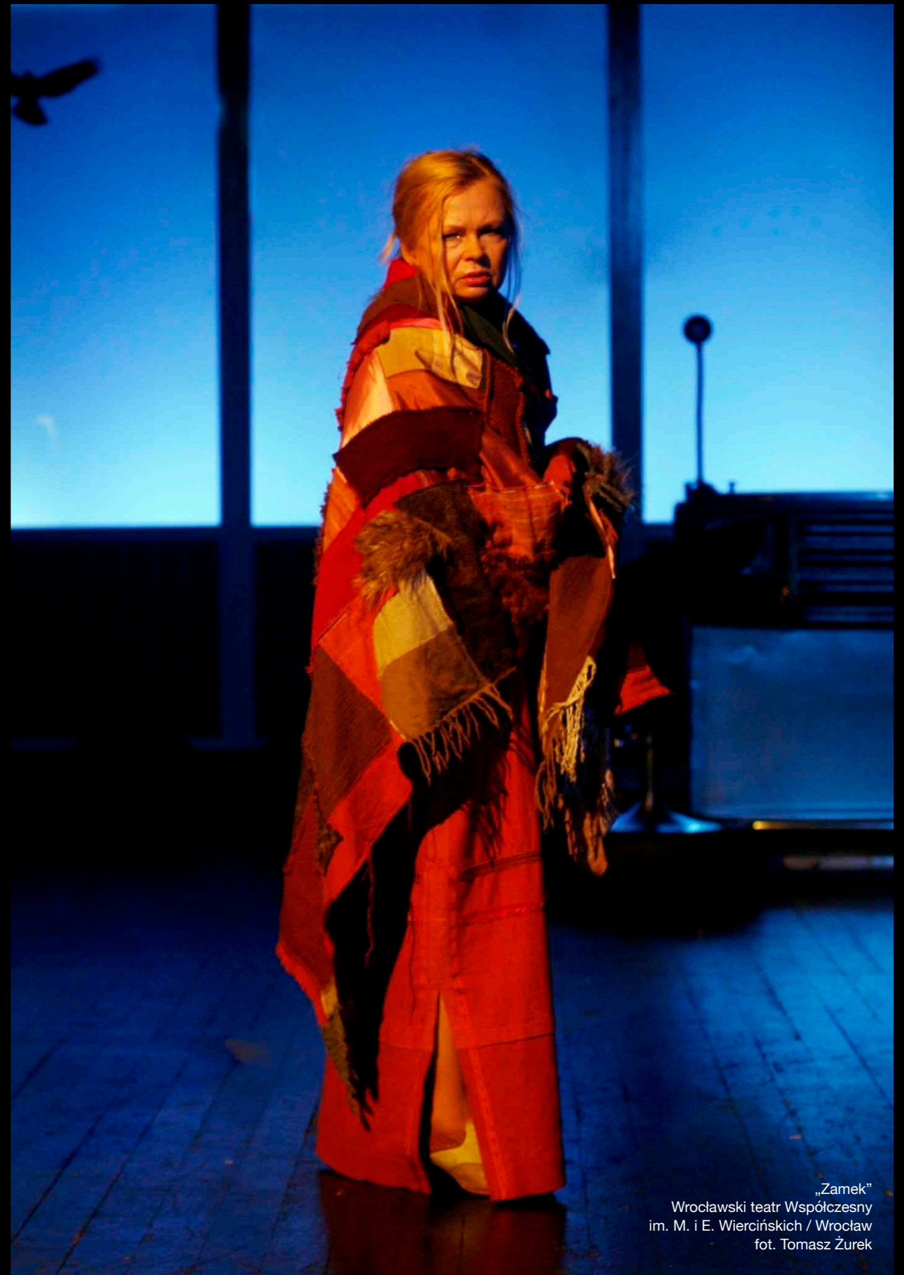
„Zamek” Wrocławski teatr Współczesny im. M. i E. Wiercińskich / Wrocław